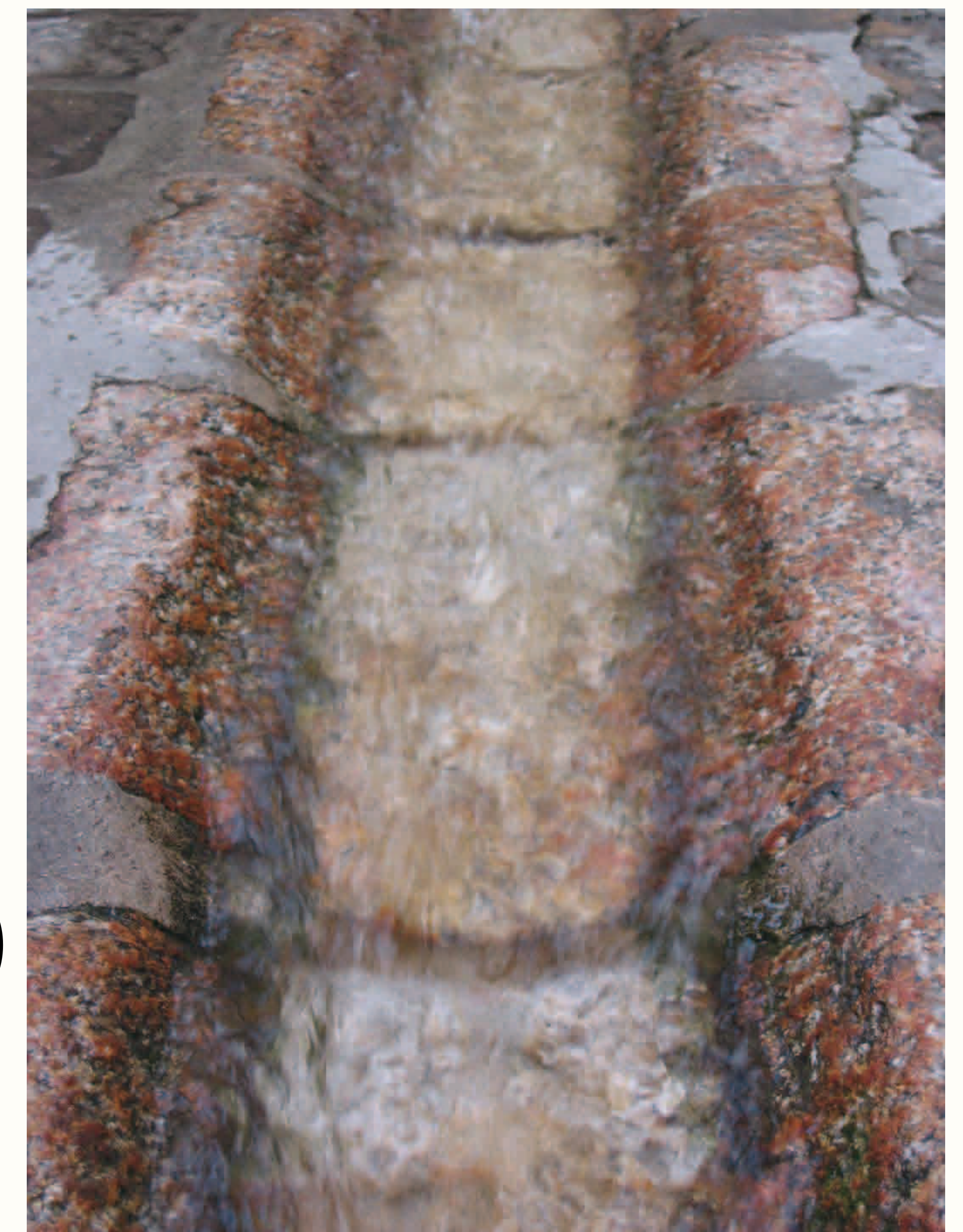
Béal - Saint-Martin-Vésubie

Entre le début du XV e et le milieu du XVI e siècle, les réseaux sont amplifiés et étendus à de nouvelles parties du territoire. Le béal qui traverse le village dès 1419 en est un exemple.