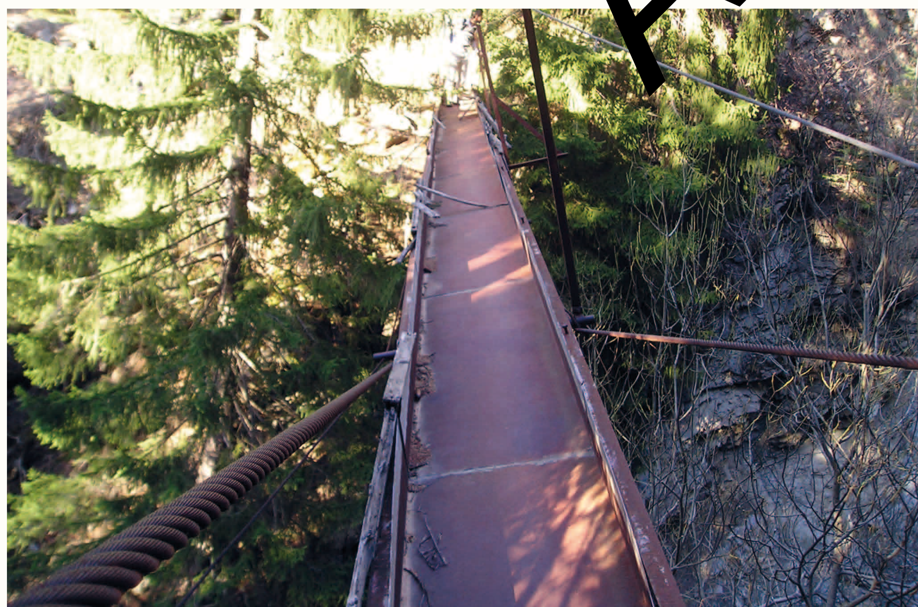
Canal Puy Sobran

Le cadastre de 1875 permet d'identifier 71 canaux parcourant le territoire de Saint-Martin sur plus de 57 km de linéaire. Parmi ces canaux, celui de Nantelle est le dernier à être encore en activité et géré comme l'ont été les autres structures d'irrigation de la commune.