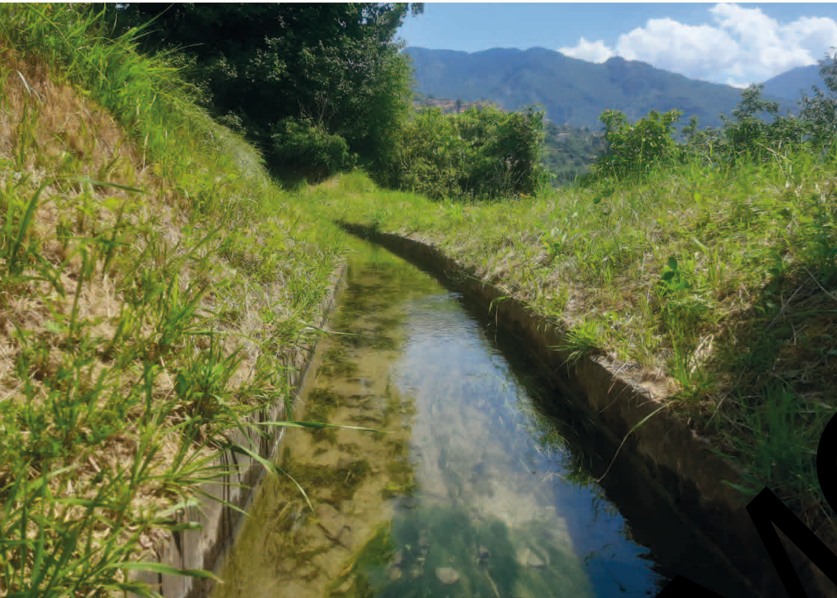
Canal du Mounart - Vue sur Belvédère

Cependant, l'infrastructure actuelle de canaux en activité et ceux abandonnés pourrait être très incomplète car elle semble avoir été beaucoup plus transformée que dans les autres communes des vallées de la Vésubie et du Valdeblore. Selon la tradition, Roquebillière ou Rocabière « le Rocher aux abeilles », a été reconstruit à plusieurs reprises à des endroits différents ce qui nous laisse supposer que d'autres canaux construits en des temps plus reculés ont existé ailleurs. Ils ont également pu servir de bases pour des canaux plus récents.