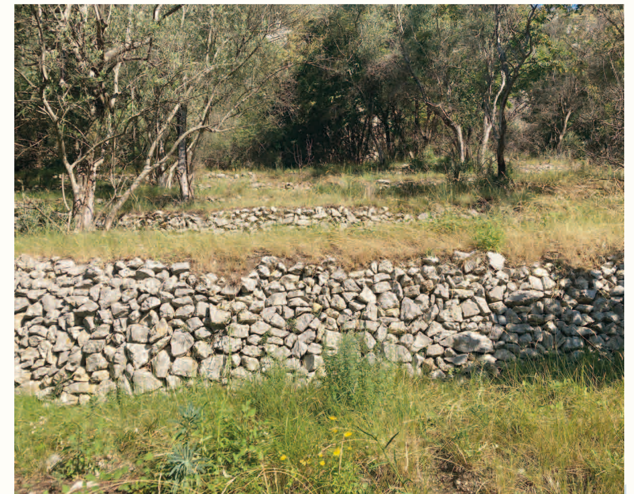
Canal du Mounart Oliveraies