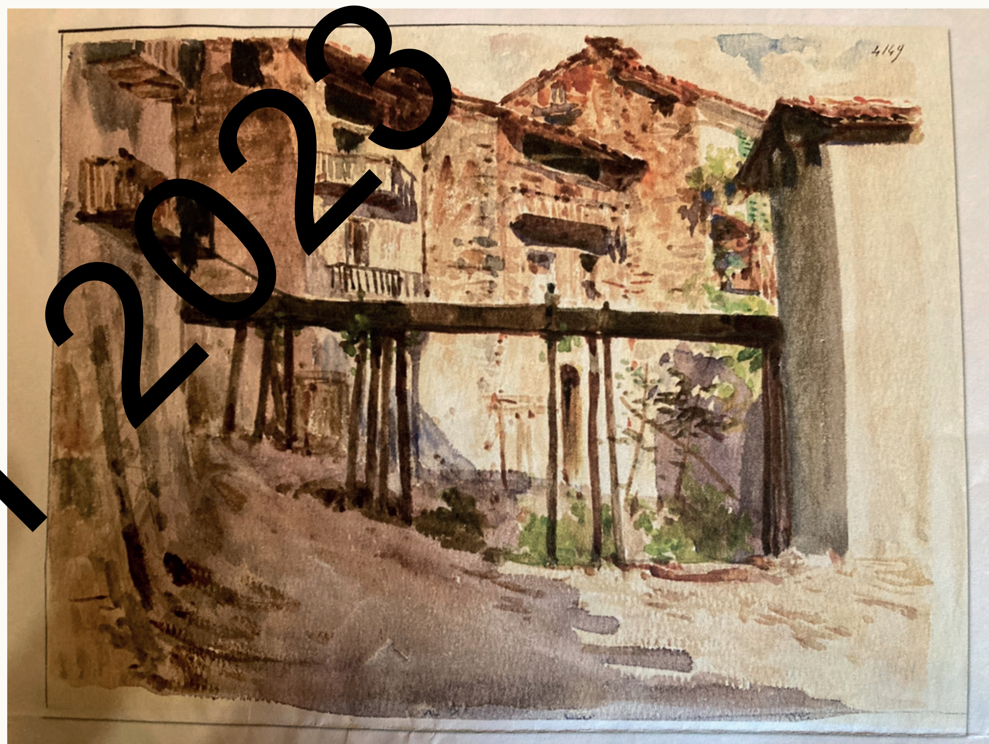
Aquarelle Alexandre Mossal (Archives A. Grinda)

Acte de 1450 concernant la possession par divers propriétaires d'une béalière antique (Arch. dép. Alpes-Maritimes fond Belvédère 102/34)